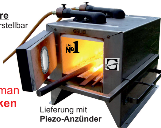
Lieferung mit Piezo-Anzünder